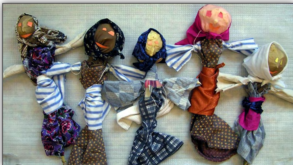
Čarodějnice – 1.tř. Loutky