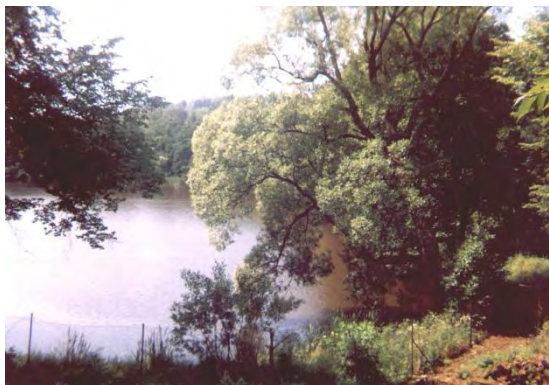
Přední (Loch, Mlýnský) rybník