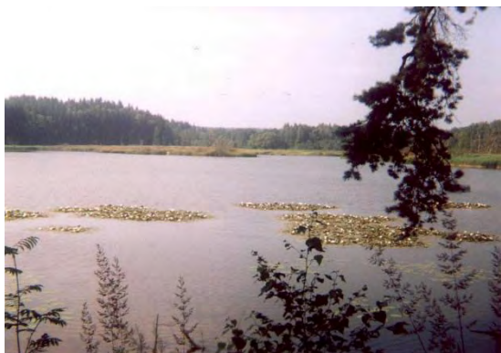
Zadní (Velký, Kněžský) rybník

Vrátíme-li se k mostu, pak v dolním konci náměstí zamíříme vpravo Mlýnskou uličkou po Havlíčkově stezce k rybníkům, které jsou vedeny jako