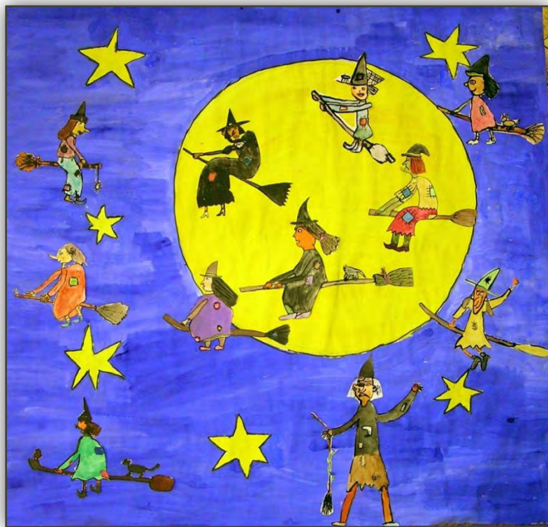
„Slet čarodějnic“ – 5.tř. komb. technika, kolektivní práce

Jaro -1.tř. komb. technika, kolektivní práce