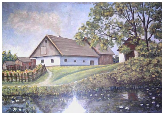
Rybníční hájenka - repro (malba Karla Šindeláře kolem roku 1920)

Mezi Mlýnářovým kopcem a budovou bývalé fary je louka nazývaná „kněžská“. Když ji sekají, většinou pak prší. Kdysi patřival ten pozemek mezi dvěma potoky opuštěným sirotkům. Z tvrze se na tu tučnou louku chtivě díval zeman a bezbranné děti o ni připravil. V slzách ho proklely, aby ze svého lupu nikdy nesklidil ani jedinou kupku sena. Už dávno tu neseká trávu panská chasa, ale o senách tu prší skoro pokaždé. „Sirotci pláčou“, říká se.