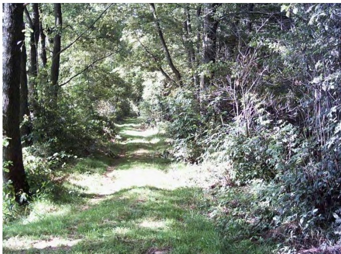
Cesta k bývalé hájence je dnes jen zřídka využívána a není upravovaná