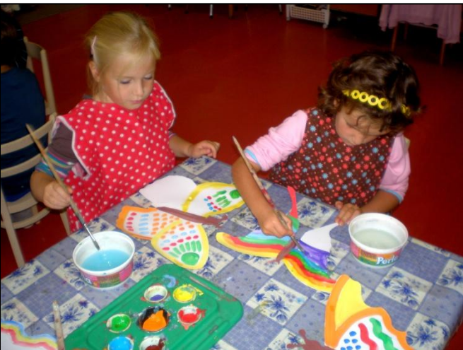
Mladší děti činnosti v MŠ zase provází plyšová

Pro starší děti je připraven třídní vzdělávací plán Rok s motýlky .