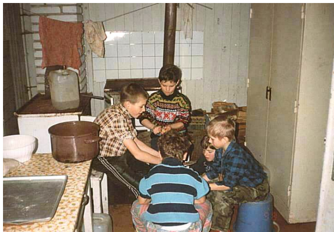
V klubovní kuchyni ... pár brambor do hrnce